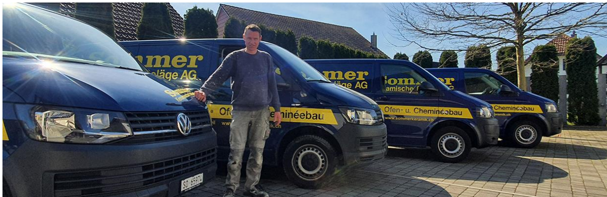
Keramische Beläge Badzimmer: